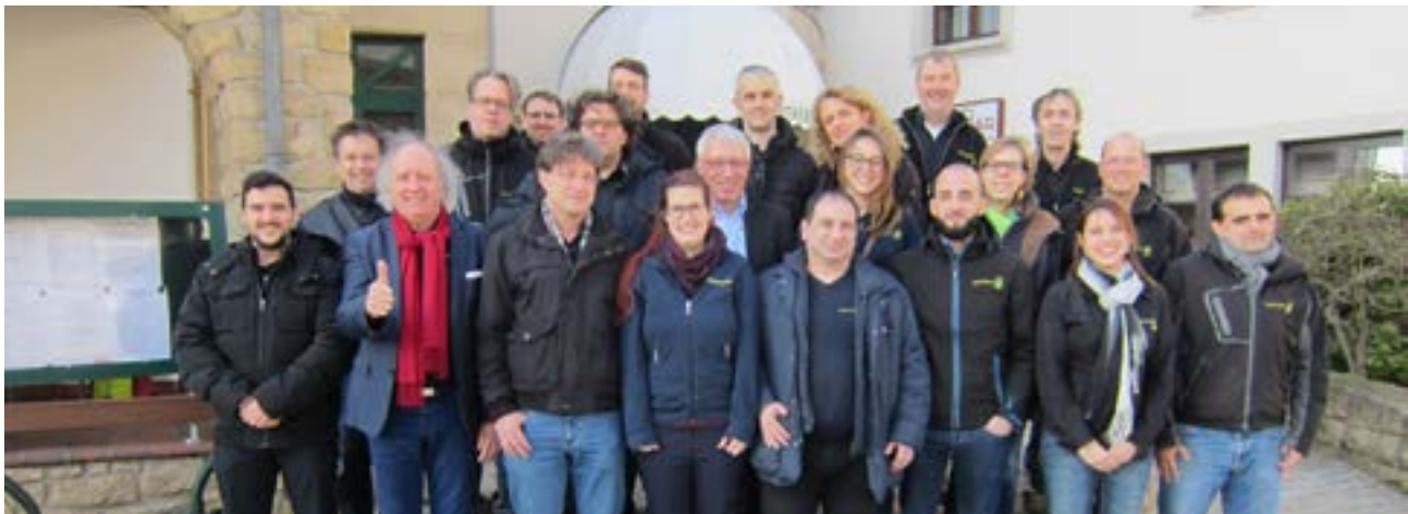
Kompetente Beratung für eine ökologische Abfallwirtschaft

Das Angebot der SuperDrecksKëscht® fir Betriber richtet sich an alle Akteure der Luxemburger Volkswirtschaft, seien es Betriebe oder Einrichtungen aus dem privaten und öffentlichen Bereich. Beispiele sind : Industrie, Handwerk, Gastronomie und Tourismus, Bankensektor, Behörden, Schulen. Auch landwirtschaftliche Betriebe nutzen inzwischen das Angebot. Für Baustellen oder Gemeinschaftswohnanlagen (Residenzen) gibt es spezielle Konzepte. Das Konzept ist eingebettet in nationale Aktivitäten, wie z.B. der Klimapakt oder das nationale Label für nachhaltiges Bauen (LENOZ).