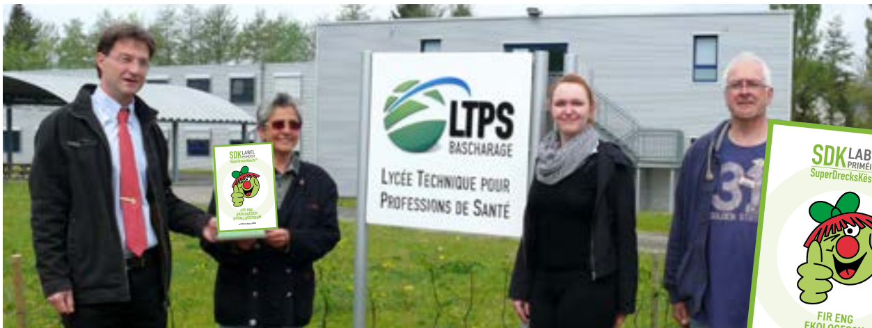
Offizielle Auszeichnung mit dem Label

Das Qualitätslabel SuperDrecksKëscht® fir Betriber ist ein Gütezeichen für eine umweltgerechte Abfallwirtschaft. Es wird vom Ministerium für Umwelt, Klima und nachhaltige Entwicklung sowie den Partnern Chambre des Métiers und Chambre de Commerce verliehen. Das Label ist zertifiziert nach der internationalen Norm ISO 14024, die die Vorgaben an die Prüfprozedur und die Anforderungen an die Prüfer beinhaltet.