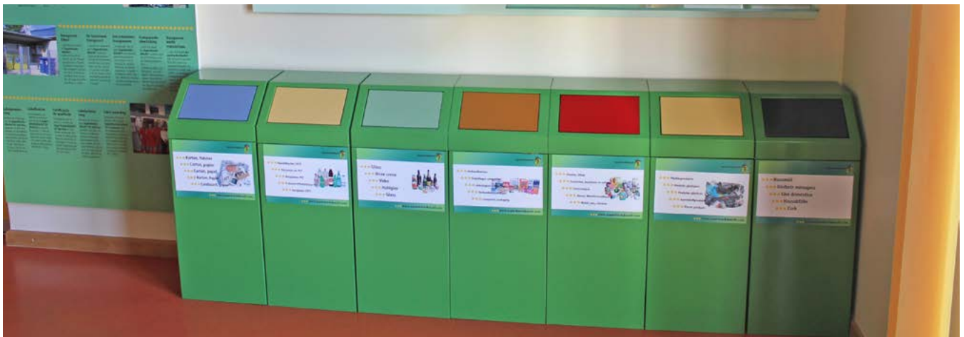
Getrennte Erfassung von Produkten und Vermeidung - beides gehört zusammen.

Der Umgang mit Abfällen stellt hohe Anforderungen an die Abfallerzeuger. Im modifizierten Gesetz über die Abfallwirtschaft vom 09. Juni 2022 wird die Berücksichtigung der EU-Abfallhierarchie und der nationalen Zero Waste-Strategie explizit von Betrieben gefordert. Bei der Bewirtschaftung der Abfallprodukte stehen Vermeidung und Wiederverwendung an erster Stelle. Dann folgt stoffliches Recycling im Sinne der Circular Economy, vor sonstiger Verwertung (z.B. energetischer Verwertung) und vor finaler Beseitigung. Ein intelligentes Abfallmanagement ist nicht nur ökologisch und nachhaltig, es hilft auch Kosten zu reduzieren und stärkt so die Wettbewerbsfähigkeit.