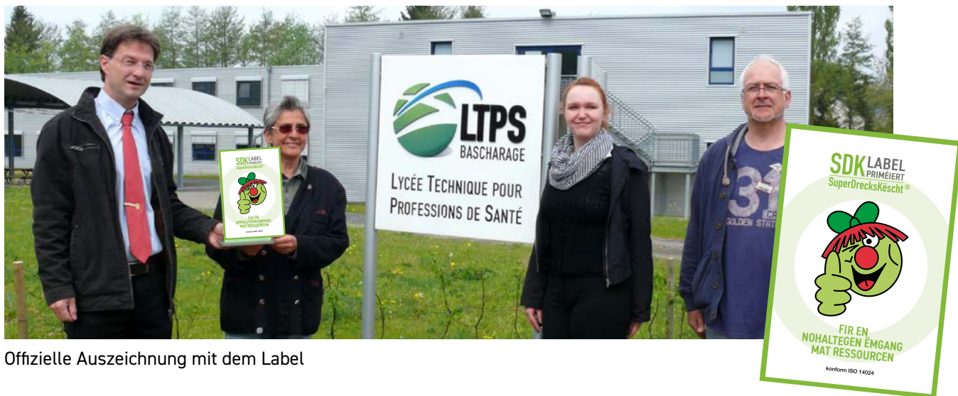
Offizielle Auszeichnung mit dem Label

Das Qualitätslabel SuperDrecksKesch® fir Betreiber ist ein Gütezeichen für eine umweltgerechte Abfallwirtschaft. Es wird vom Ministerium für Umwelt, Klima und nachhaltige Entwicklung sowie den Partnern Chambre des Métiers und Chambre de Commerce verliehen. Das Label ist zertifiziert nach der internationalen Norm ISO 14024, die die Vorgaben an die Prüfprozedur und die Anforderungen an die Prüfer beinhaltet.