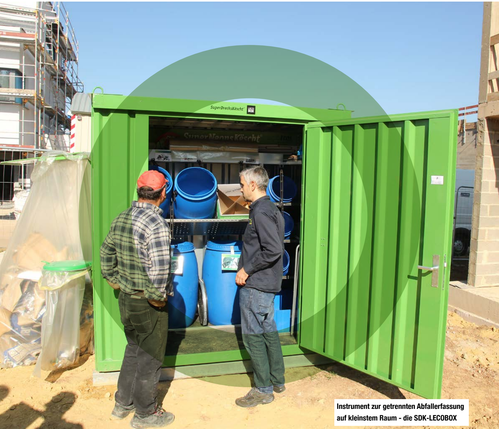
Instrument zur getrennten Abfallerfassung auf kleinstem Raum - die SDK-LECOBOX