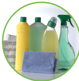
Wasch- und Reinigungsmittel