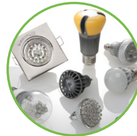
Leuchtmittel (Lampen) und Leuchten