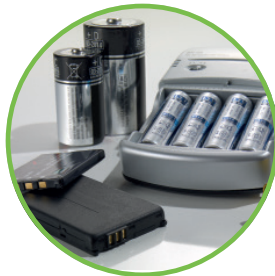
Aufladbare Akkus und Ladegeräte

Accumulateurs rechargeables et chargeurs