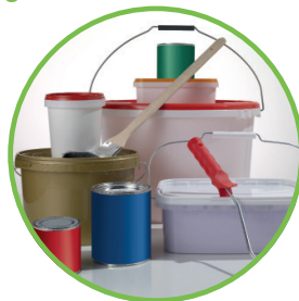
Farben, Lacke und Lasuren