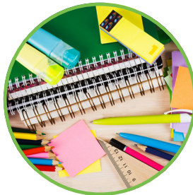
Schul- und Büromaterial

Accumulateurs rechargeables et chargeurs