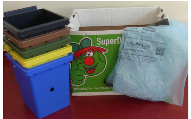
Set der Abfalleimer (SDK, Schwarz, Blau, Gelb, Grün, Braun, Valorluxtüte)