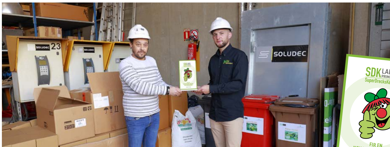
Offizielle Auszeichnung mit dem Label

Das Qualitätslabel SuperDrecksKëscht® fir Betreiber ist ein Gütezeichen für eine umweltgerechte Abfallwirtschaft. Es wird vom Ministerium für Umwelt, Klima und nachhaltige Entwicklung sowie den Partnern Chambre des Métiers und Chambre de Commerce verliehen. Das Label ist zertifiziert nach der internationalen Norm ISO 14024:2018, die die Vorgaben an die Prüfprozedur und die Anforderungen an die Prüfer beinhaltet.